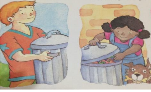
Şekil 5. Doğayı sevme ve koruma değeri görsel örneği (Okul B, Örnek Olmak Zor Mu? Pat Thomas Çev. Özlem Mumcuoğlu, 2011).

Doğayı Sevme ve Koruma değerini temsil eden görseller incelenirken de yine metin bölümünde yer alan sözcükleri temsil eden; bahçeyi çapalamak, fidan dikmek, ağaç sulamak, doğa için afişler hazırlamak, çöpleri toplamak ya da çöpleri çöp kutusuna atmak gibi çizimler kodlanmıştır. Örneğin Şekil 5'te doğayı sevme ve koruma değerini gösteren görselde çocuklar çöpleri çöp kutusuna atmaktadır.