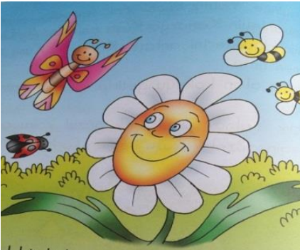
Şekil 2. Arkadaşlık değeri görsel örneği (Okul E, Yalnız Çiçeğin Öyküsü , Turgay Arıcıoğlu, 2008)

Tablo 7’ye göre kişilerarası değerler kategorisi altında yer alan Arkadaşlık ( N=119 ) tüm okullarda incelenen resimli çocuk kitaplarında en çok işlenen değer olarak ortaya çıkmıştır. Bu değerleri temsil eden görseller incelenirken metin bölümünde yer alan sözcükleri temsil eden; birlikte oyun oynamak , arkadaşıyla birlikte okula gitmek , birlikte suya girmek , sandal gezisi yapmak , birlikte vakit geçirmekten mutlu olduğunu gösteren yüz çizimleri arkadaşlık değeri olarak kodlanmıştır. Örneğin Şekil 2’de arkadaşlık değerini gösteren görselde çiçek hep yalnızlıktan şikâyet ederek bir arkadaşının olmasını çok istiyor. Bir kelebek gelip çiçeğin üzerine konuyor. Ardından başka böcekler de geliyor ve çiçek hepsiyle arkadaş oluyor.