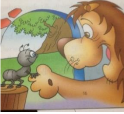
Şekil 6. Barış değeri görsel örneği (Okul A, Akıllı Karınca Dodi, Turgay Arıcıoğlu, 2007)

Toplumsal değerler kategorisi adı altında yer alan Barış değeri ( N=1 ) tüm okullardaki resimli çocuk kitaplarında en az işlenen değer olarak ortaya çıkmıştır. Bu değerleri temsil eden görsel olarak verilen Şekil 6'da aslan karıncayla el sıkışıp barışmaktadır.