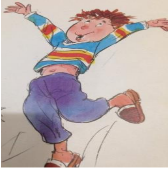
Şekil 1. Mutluluk Değeri görsel örneği (Okul F, Ninem Örgü Örüyor , Aysel Gürmen, 2009)

Kişisel değerler kategorisi altında yer alan Özeleştir ( N=6 ) tüm okullardaki resimli çocuk kitaplarının görsellerinde en seyrek gözlenen değerdir. Bu değeri temsil eden görseller incelenirken metin bölümünde yer alan kişisel özelliklerini beğenmediğini gösteren üzgün ya da şaşkın yüz ifadeleri gözlemlenmiştir. Kişisel değerler kategorisi altında kitapların görsellerinde dürüstlük değerine ilişkin ise herhangi bir kod gözlenmemiştir.