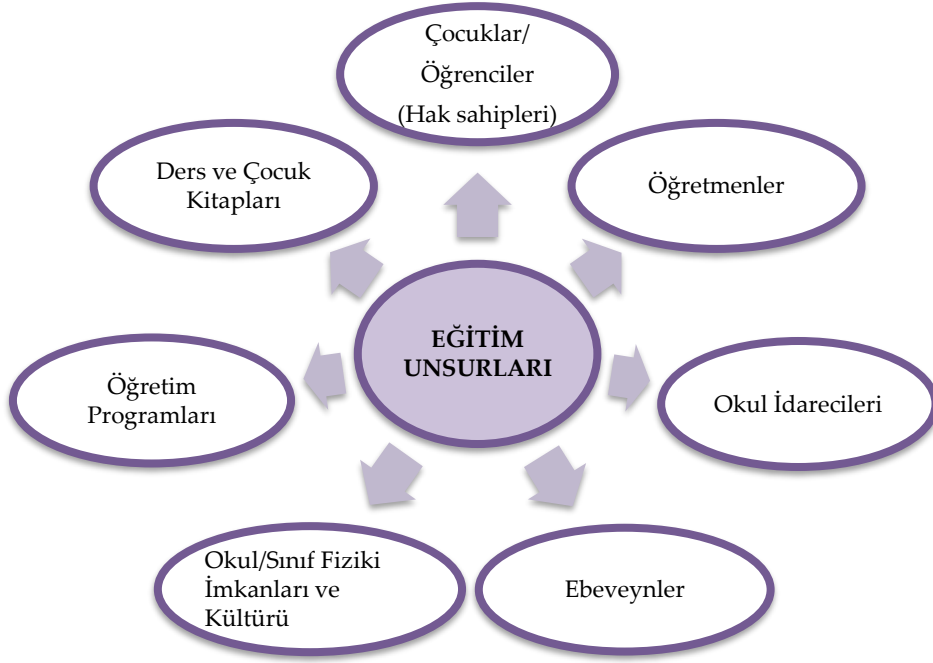
Şekil 1. Araştırma kapsamında ele alınan eğitim unsurları

Yukarıda belirtilen unsurlar penceresinden bakıldığında çocuklarımızın , kendi haklarına ilişkin yeterli bilgi birikimine ve farkındalık düzeyine sahip olma durumlarının ele alınması, çocuk haklarının eğitim unsurları açısından geliştirilmesi hususunda gerekli görülmektedir. Ersoy (2011), çocukların etkin birer vatandaş olmalarını, haklarını bilmeleri ve kullanabilmeleri şartına dayandırmış ve bu nokta çocukların kendi haklarını öğrenmeleri ve bu hakları kullanma becerisine sahip olmalarını, demokratik değerlerin edinilmesi açısından da gerekli görmektedir. Bu noktada kamu hizmeti (eğitim) alıcısı olarak çocukların kendi haklarına ilişkin farkındalığa sahip olma durumuna ilişkin hâlihazırdaki tespitler, çocuk hakları konusunda hakkın sahiplerine yönelik olarak atılacak adımlara ışık tutacaktır.